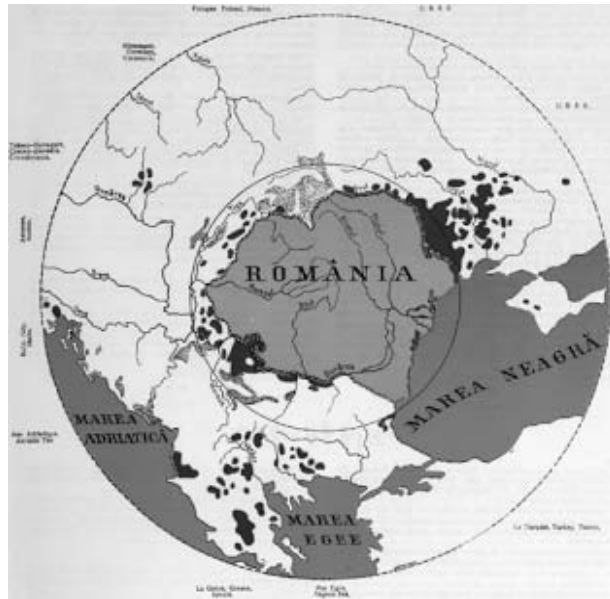
Figura 2. Romulus Seișanu, op.cit. , p. III. „Expansiunea geografică a elementului român [comunități istorice] în afară de frontierele României”.

În plan extern, neamul reprezintă spațiul de interes al României și elementul de substrat al coeziunii regionale. Neamul înseamnă spațiu. Iar spațiul este componentă a securității.