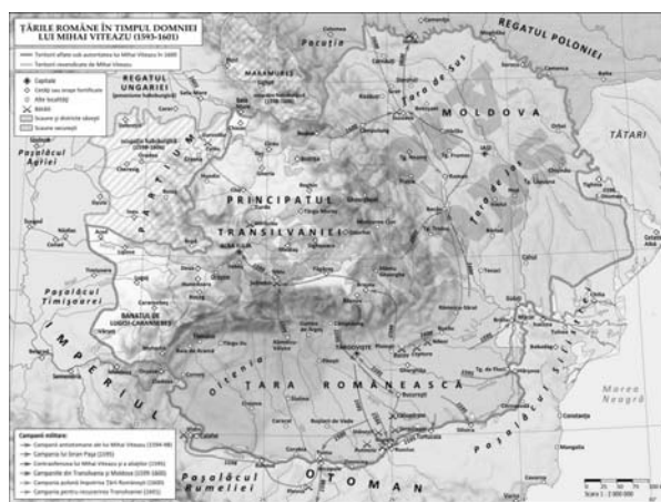
Harta 2. Harta Țărilor Române în timpul lui Mihai Viteazul 23 .

Marea Unire de la 1 decembrie 1918 a însemnat pentru români, fără a lăsa loc de interpretare, redobândirea de facto a spațiului de viațuire originar Dacia Felix, în care au trăit strămoșii noștri daco-romani. De unde însă urma de îndoială asupra apartenenței Transilvaniei și Basarabiei la România, de-a lungul istoriei până în prezent? Cel mai probabil, blocajul psihologic în derularea firească a istoriei neamului românesc stă în faptul că Unirea de la 1600 înfăptuită de Mihai Viteazul a fost de scurtă durată și preponderent recunoscută de anumiți autori ca fiind o prima Unire strict politică , chiar dacă memorabilă a celor 3 (trei) țări românești într-un stat unitar (vezi Harta 2).