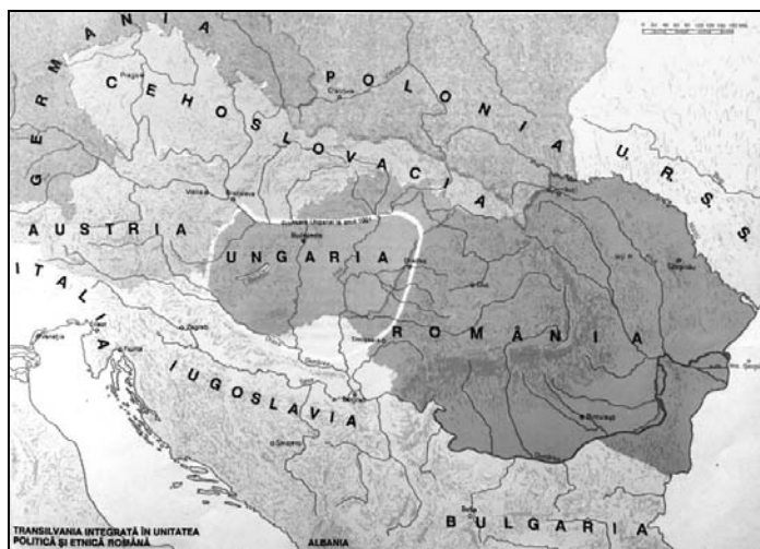
Harta 1. Europa Centrală 1918–1940 22 .

Cu un singur argument se poate demonta acest derapaj (mai mult în partea a doua a studiului), și anume chiar prin aducerea în față a hărții Europei Centrale din 1918–1940, care ne arată că delimitarea Ungariei prin Tratatul de la Trianon nu diferă de frontierele Regatului Ungar din anul 1001 (Harta 1).